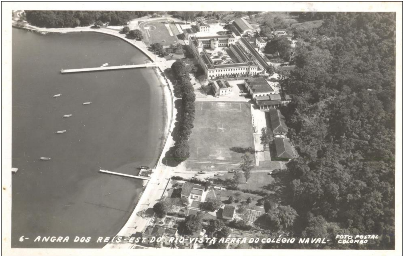
Vista do Colégio Naval - 1963